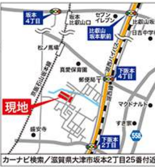
カーナビ検索/滋賀県大津市坂本2丁目25番付近