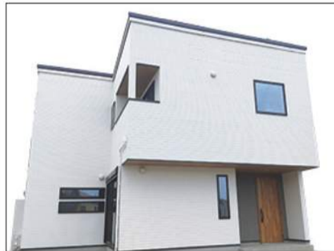
●木造2階建 ●R4年3月完成(売主)

3,230万円(税込) ◆土地129.78㎡(約39.25坪) ◆建延109.30㎡(約33.06坪)