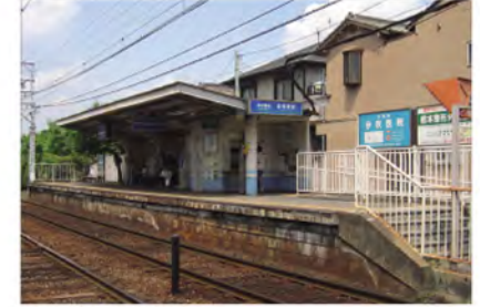
京阪石山坂本線「滋賀里」駅