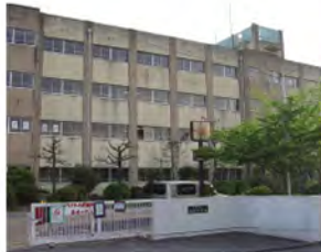
●唐崎小学校 ..... 徒歩11分