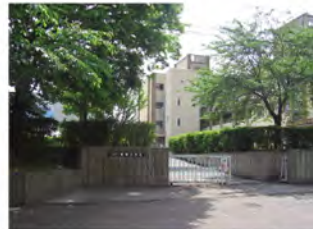
●唐崎中学校 ..... 徒歩14分