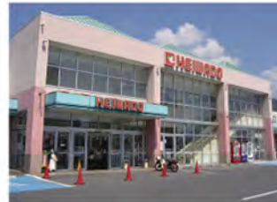
●フレンドマート唐崎店 ..... 徒歩5分