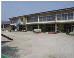
●唐崎幼稚園 ..... 徒歩10分