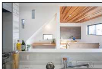
☆お料理しながらリビングでの会話に参加できます！

現地には係員が常駐しておりません。大変お手数ではございますが事前にご連絡をお願い致します。