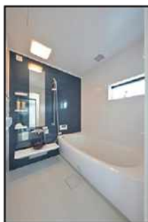
☆ゆったりとしたユニットバス