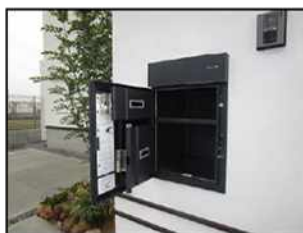
☆宅配ボックス付きの為非対面で荷物の受け取り可能

◎大津市下阪本3丁目◎木造2階建て◎第1種中高層住居専用地域◎建ぺい率60%◎容積率200%◎令和2年2月完成【売主】