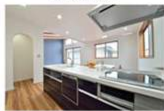
人気のオープンキッチン