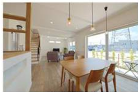
化粧梁・塗り壁仕上げ