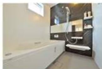
大きな浴槽でゆったりバスタイム