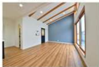
リビングに勾配天井