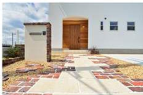
アンティークレンガ使用