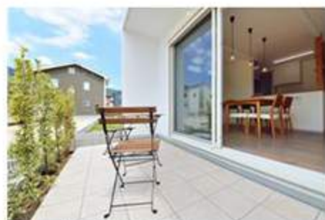
プールもできる大きなタイルデッキ