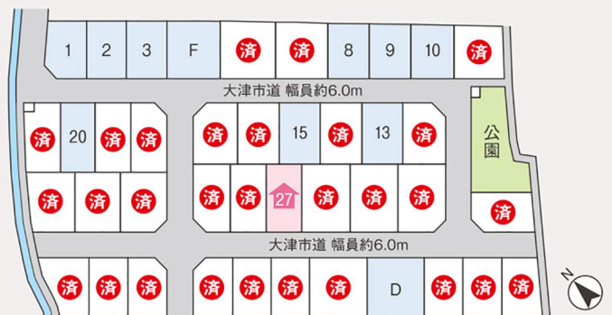
27 オープンハウス会場