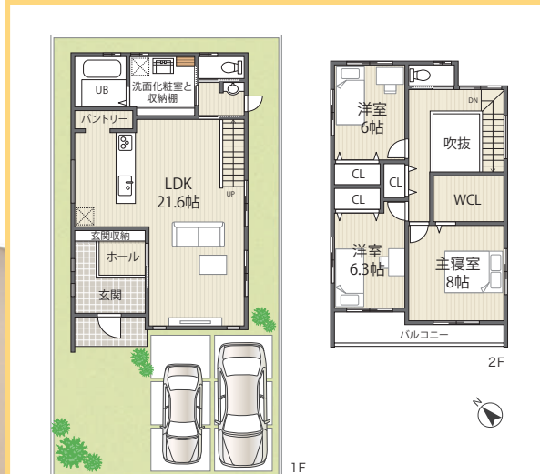
【ウエストレイク下阪本5丁目 26号地】