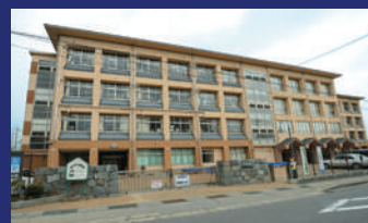
通いやすい教育施設