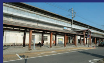
利便性のよい交通