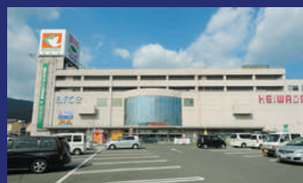
充実した買い物施設