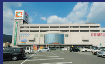
充実した買い物施設