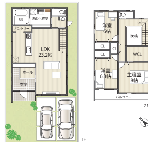
【ウエストレイク下阪本5丁目 26号地】